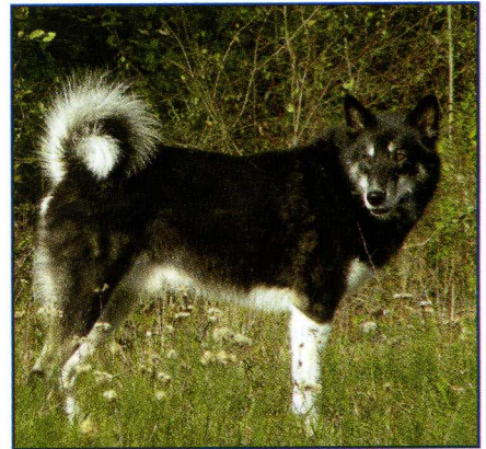
West Siberische Laika

De naam Laika is eigenlijk geen rasaanduiding maar komt van het Russische woord 'lajatj', wat blaffen betekent. Sinds mensenheugenis is de Laika een hond die met de mens samenleeft en samenwerkt als trekker, jager en waker. Door verschil in gebruik en door verschil in geografische oorsprong zijn er vele typen ontstaan die onderling van uiterlijk verschillen.