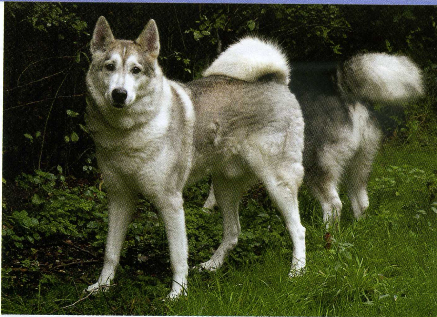
Een West Siberische Laika met een lichte kleurstelling.

niet WSL van een zelfde type te kruisen maar, juist doelbewust, verschillende karakteristieken te kruisen. Anderzijds waren er ook jagers en kynologen die sterk waarde hechte aan het behouden van de kwaliteiten van de Mansijskaja en de Chantejskaja Laika.