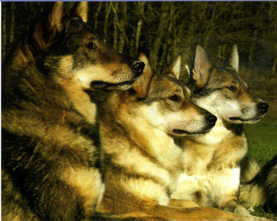
West Siberische Laika.

den in het land van oorsprong hebben geleid tot het prachtige onbedorven, pure uiterlijk dat de WSL momenteel nog heeft. Nederlandse WSL hebben al acht Wereldkampioenschapstitels veroverd wat aangeeft dat ze zeker op tentoonstellingen gezien en bewonderd worden om hun natuurlijke uiterlijk en soepel bewegen. Maar het zou wel jammer zijn om