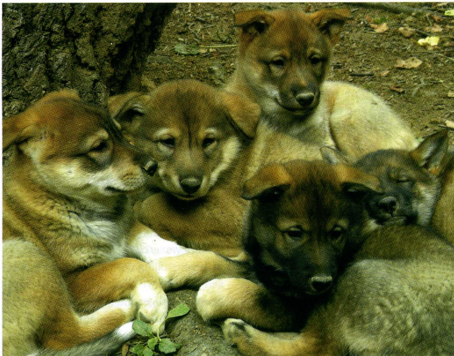
West Siberische Laika pups.

De hond reageert in zijn algemeen heel goed op stemcorrectie en een harde hand is beslist niet nodig en zelfs onwenselijk. In het algemeen doorlopen de WSL met glans de gehoorzaamheids-