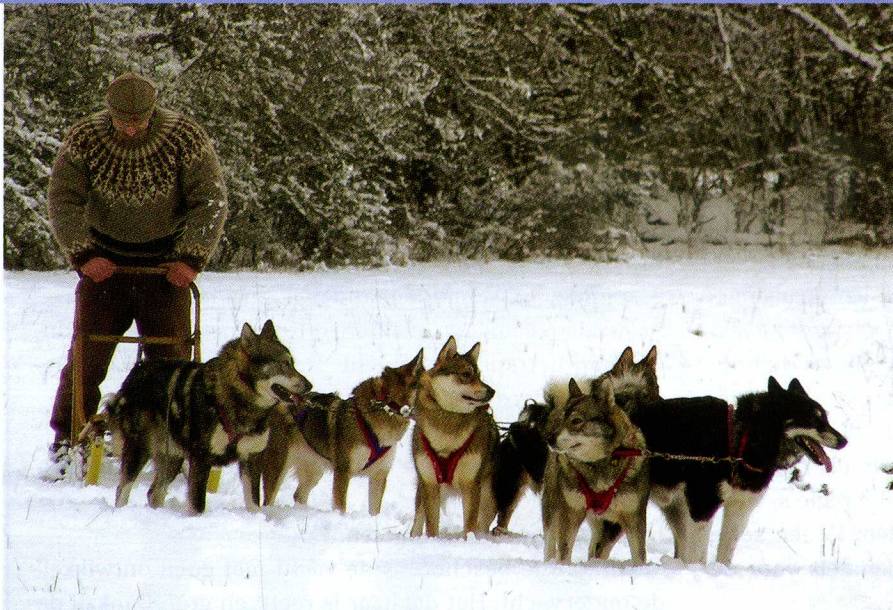
West Siberische Laiki blinken uit in veelzijdigheid.

nenzoekers en reddingshonden. Ook als waak- en verdedigingshond heeft het ras zijn sporen verdient. Een Laika is zeer beweeglijk en behendig, heeft een groot coördinatievermogen, kan goed luisteren en is mensgericht. Zoals bij een natuurras hoort, beschikt hij over een gezonde portie jachtdrift. Als blindengeleidehond is hij door zijn beweeglijkheid niet geschikt maar, zowel in het land van oorsprong als ook daarbuiten, wordt hij tevens gewaardeerd als gezelschapshond.