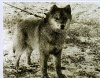
Karelo Finse Laika.