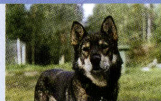
Oost Siberische Laika.

De Oost Siberische Laika is over het algemeen een iets rustiger en ietwat zwaarder gebouwde hond dan de vorige typen. Het blijft echter een Laika en dus een actieve hond. Zoals bij zijn afmeting past, heeft dit ras een wat stoerder en zelfstandiger karakter. De meest geliefde kleuren bij deze Oost Siberiër zijn de donkere kleuren maar overige kleuren, tot aan wit aan toe, komen ook voor. Zijn oorspronkelijke taken zijn het