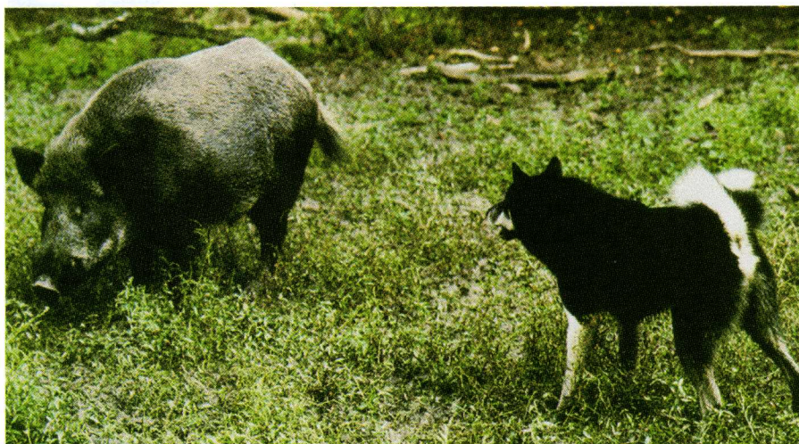
West Siberische Laika stelt wild zwijn.

Alle professionele kennels hadden een georganiseerde structuur en strenge fokregels. Veel kynologen probeerden