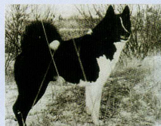
Russisch Europese Laika.

trekken van de slede, het waken en de jacht, waarbij het ras voor de jacht meestal op groot wild werd ingezet.