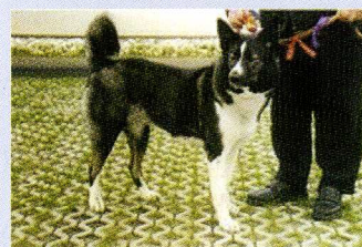
Oost Siberische Laika teef.