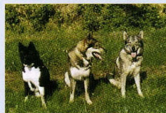
V.l.n.r.: Russisch Europese Laika teef, Oost Siberische Laika reu en West Siberische Laika teef.